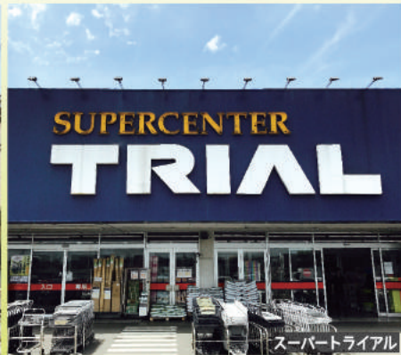
スーパートライアル